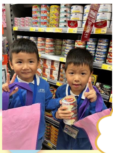
我哋買一大罐吞拿魚。